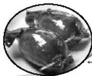
「この「イカめし」美味しそうでしょ？